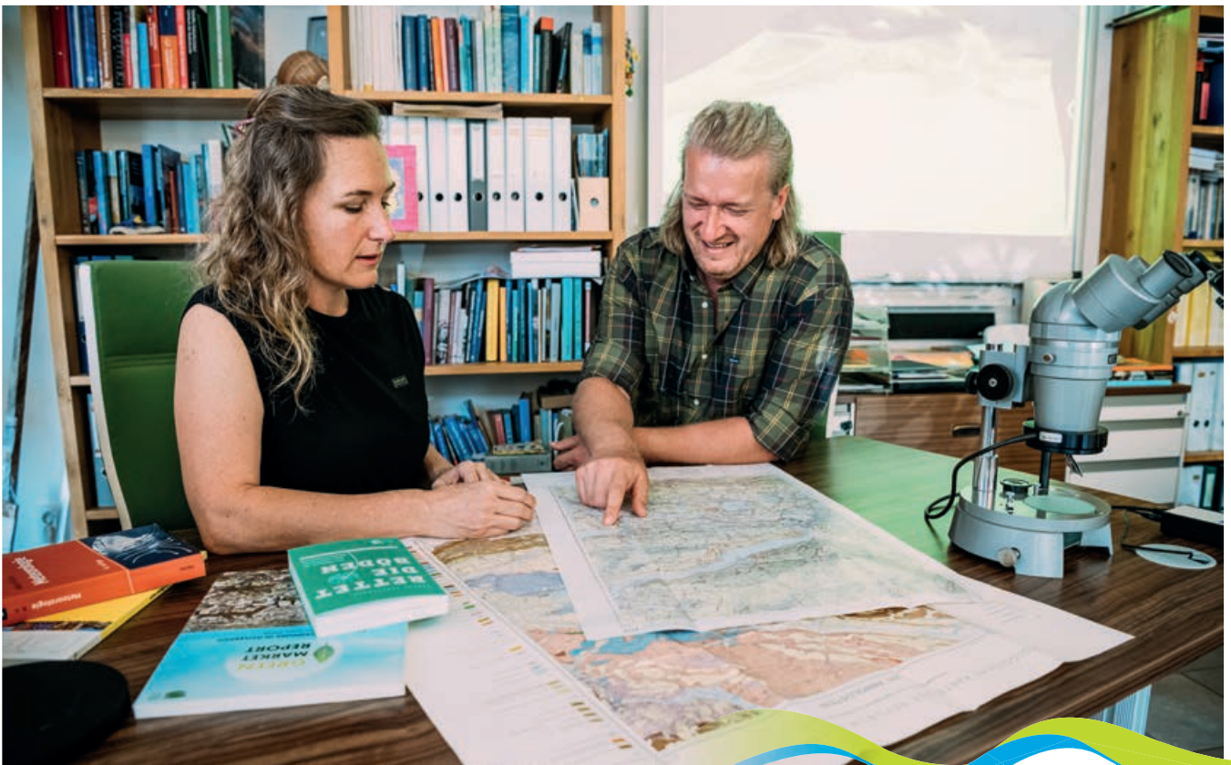
Team meraUm | © Sam Strauss

Von Lebensräumen und ihren Ökosystemleistungen bis zur nachhaltigen Regionalentwicklung.