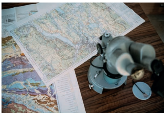
Planung | © Sam Strauss