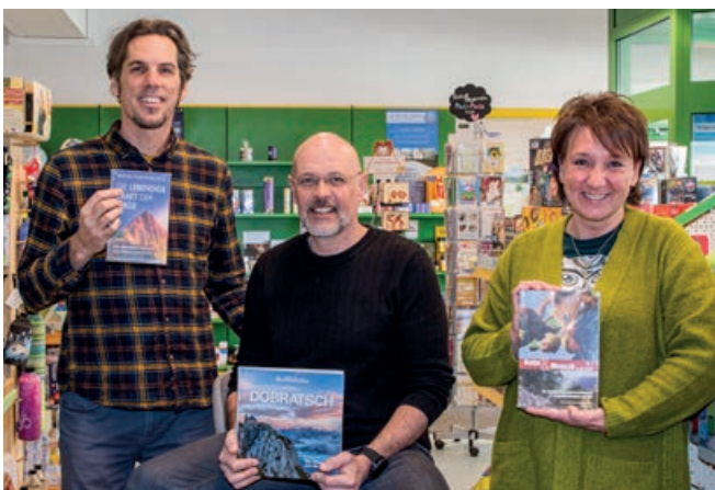
Team buch & blatt | © Christian Fatzi