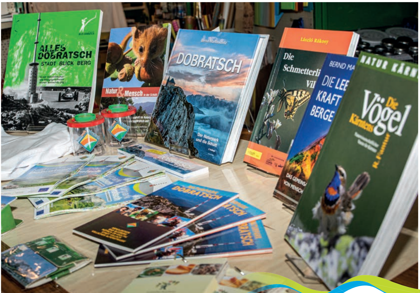
Umfangreiche Buchauswahl

In Arnoldstein, in unmittelbarer Nähe zur Klosterruine Arnoldstein, liegt meine Buch- und Papierhandlung bärnd. Wir führen sämtliche Publikationen und Wanderkarten über den Naturpark Dobratsch. Auch andere Produkte von Naturparkpartnern, wie Wein, Honig, Öle und Salze sind in meinem Geschäft erhältlich. Außerdem bin ich Autor des Buches „Dobratsch. Der Naturpark und die Schütt“, das 2019 im Hermagoras-Verlag erschienen ist. Mein Team und ich sind dadurch auch bestens informiert, falls man sich über Wanderungen, Veranstaltungen oder andere Themen im Naturpark informieren möchte.