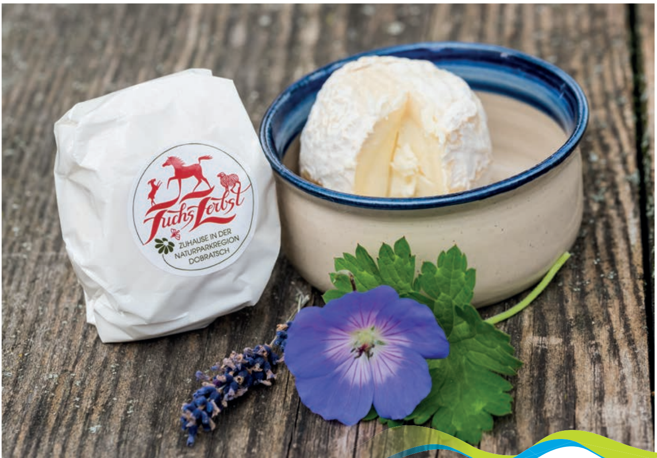
Produkte aus Ziegenmilch