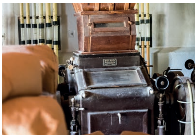
Mahlwerk