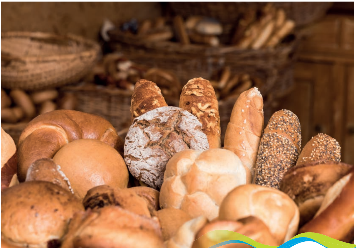
Produkte nach alter Handwerkstradition

Unser Familienbetrieb besteht bereits seit 1876 und ist seither bemüht, in guten wie in schlechten Zeiten, die Bevölkerung mit Backwaren und Mehlen zu versorgen.