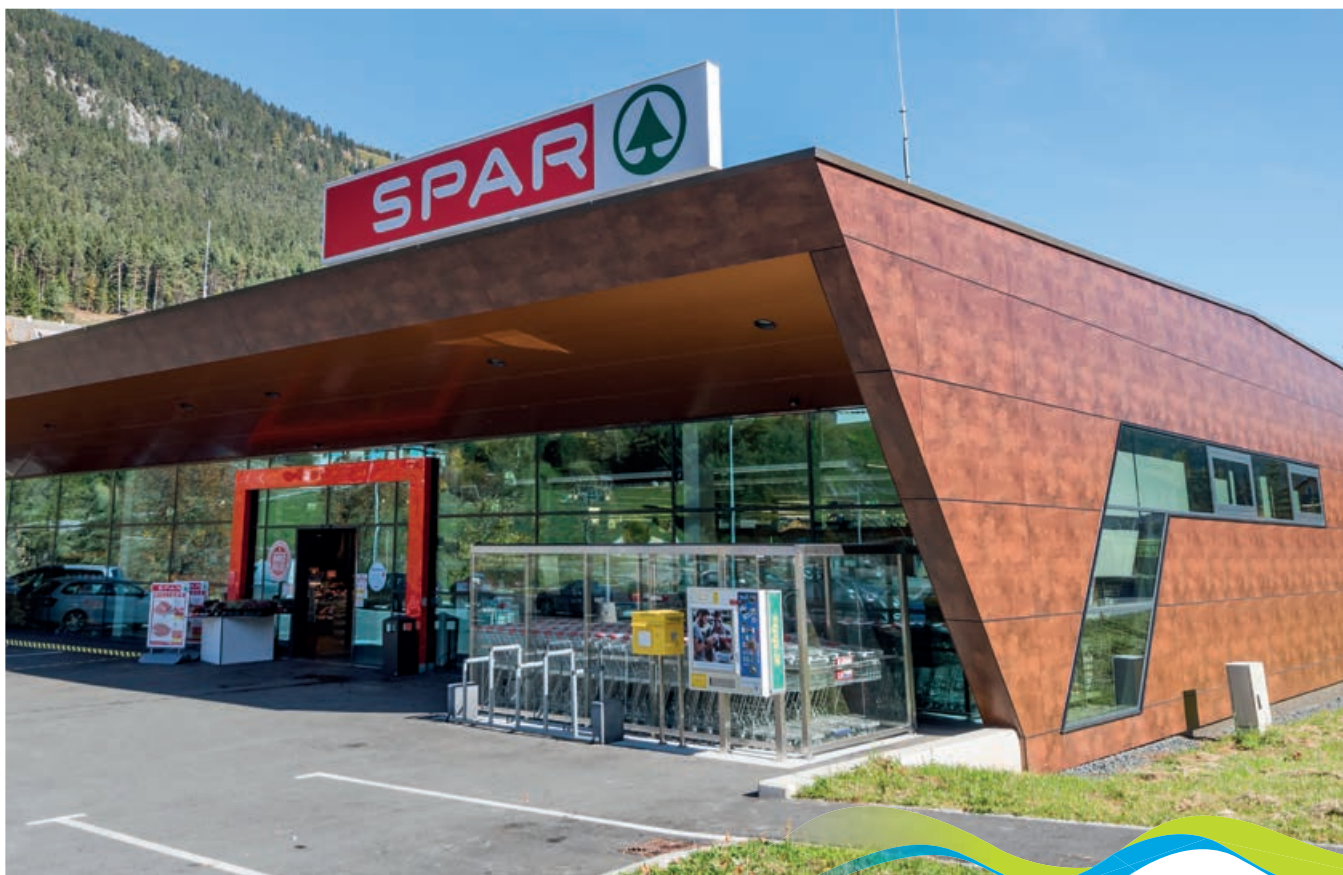
Sparmarkt Wiegele

Wir sind ein Nahversorger im Thermenhochtal Bad Bleiberg, ein Familienbetrieb in der dritten Generation und bieten unseren Kunden Frischwaren aus unserer beliebten Feinkosttheke und ein großes Angebot an regionalen Waren aller Art. Besonders stolz sind wir natürlich auf unser Naturpark Dobratsch Regal, in dem wir ausschließlich Produkte von befreundeten Naturpark Partnerbetrieben anbieten. Dazu gehören: Wurstwaren, Marmeladen, Kräutersalze, Tees, Schnäpse, Öle und Wein.