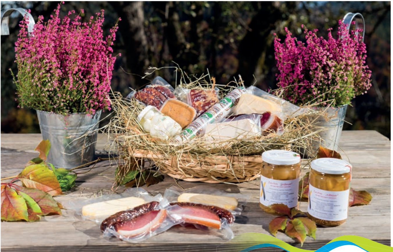
Produktpalette | © Michael Stabentheiner

Wir sind froh dort leben zu können, wo die Welt noch in Ordnung ist. In der Kadutschen ist unser Hof auf einem schönen Sonnenplateau gelegen, auf einer Seehöhe von 823 Meter im Osten der Gemeinde Bad Bleiberg. Unser Hof ist seit 356 Jahren im Familienbesitz und wir legen größten Wert auf Nachhaltigkeit und Produktqualität. Vom prämierten Speck und Käse zum unvergleichlichen, süß-sauer eingelegten Zucchini bis hin zum Reindling stellen wir alles nach alter Überlieferung selbst her.