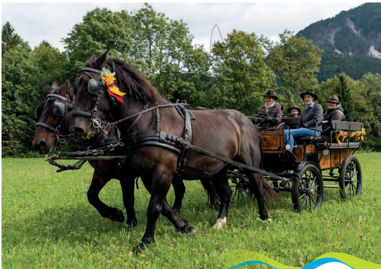
Reit- und Fahrbetrieb Silvia Gastager

Am Fuße des Dobratsch gelegen, am Anfang des Gailtales, dürfen wir mit unseren 12 Pferden und Ponys den Gästen die herrliche Landschaft während gemütlicher Kutschfahrten, geführten Ausritten oder Reit- und Fahrkursen die Gegend näher bringen. Unsere gut trainierten und trittsicheren Norikerpferde, die auch speziell hier gezüchtet werden, bieten sich besonders für Erkundungsfahrten, Wald- und Flurausritte an.