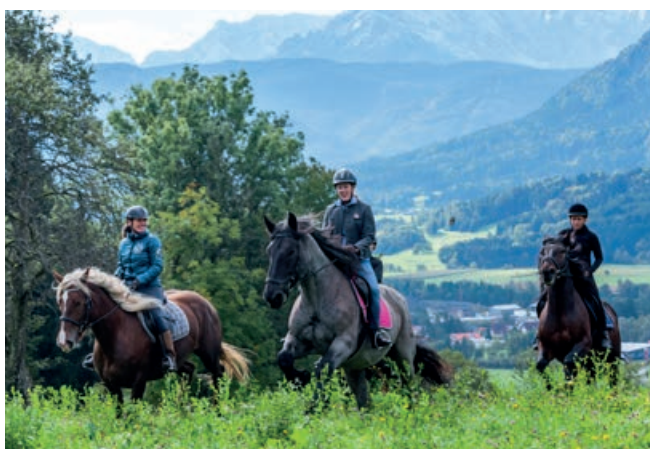
Ausritt im Naturpark