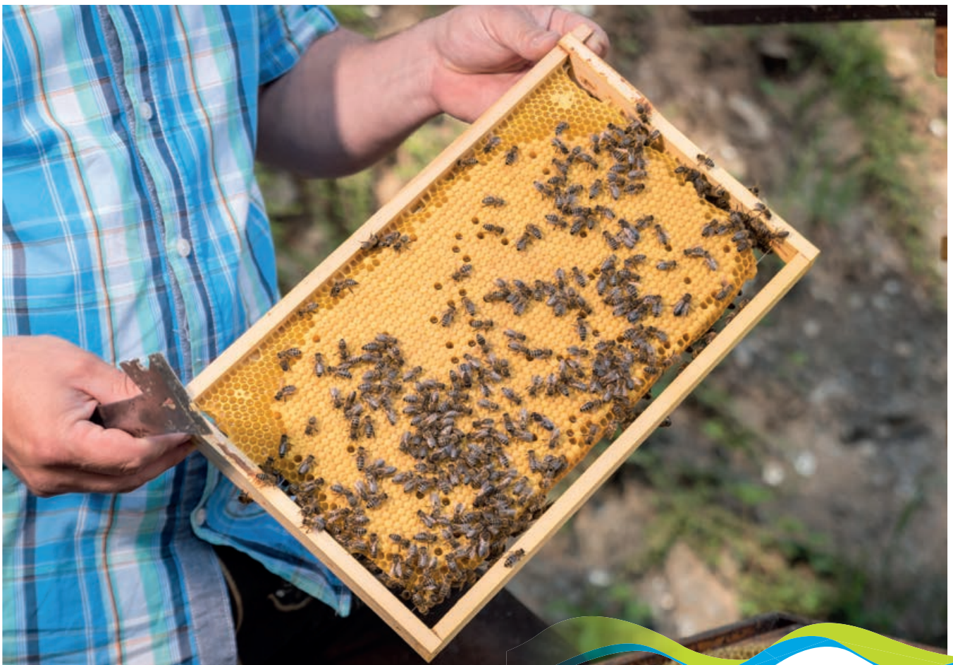
Geschlossenes Brutnest

Produkte mit sehr hoher Qualität, im Einvernehmen mit der Natur zu erzeugen und zufriedene Kunden zu haben, das ist unser Motto, an dem wir tagtäglich intensiv arbeiten.