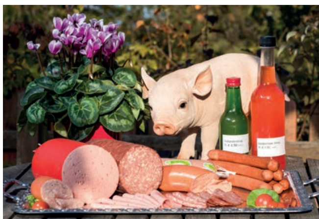
Ab Hof Verkauf