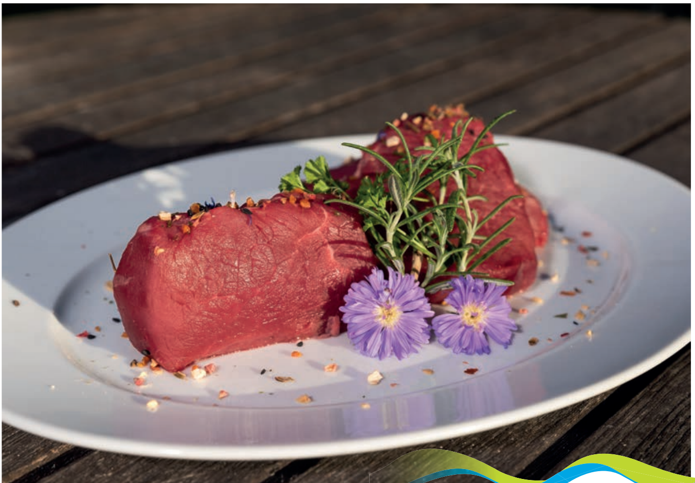
Produkte aus der Region

Unser Haus wurde vom Urgroßvater gekauft und wird nun bereits in 4. Generation erfolgreich als Familienbetrieb geführt. Wir bieten Kulinarik aus der klassischen Kärntner Kuchl, sowie eine Vielfalt von Produkten aus eigener Landwirtschaft. Außerdem vermieten wir Fremdenzimmer und Ferienwohnungen.