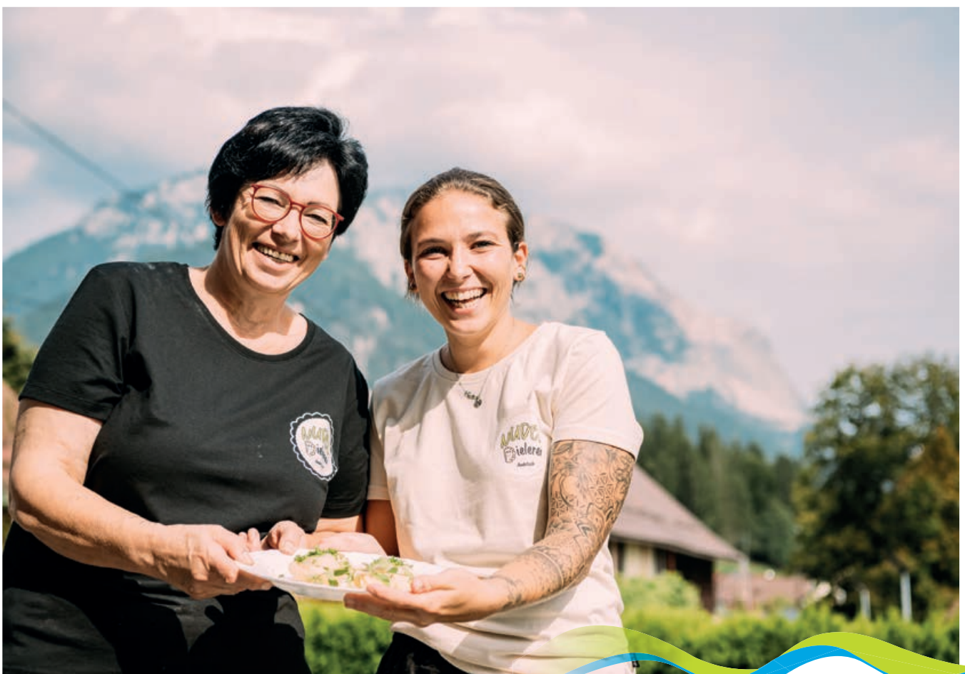
NudelDielerei | © Sam Strauss

Kärntnernudeln sind mehr als nur ein Gericht – sie sind ein Stück Kärntner Kultur und Tradition. Die liebevolle Zubereitung und die vielfältigen Füllungsmöglichkeiten machen sie zu einem besonderen kulinarischen Erlebnis. Mit Zutaten aus der Naturparkregion und dem Gailtal entstehen in der Nudel-Dielerei Produkte, deren Frische man einfach schmeckt.