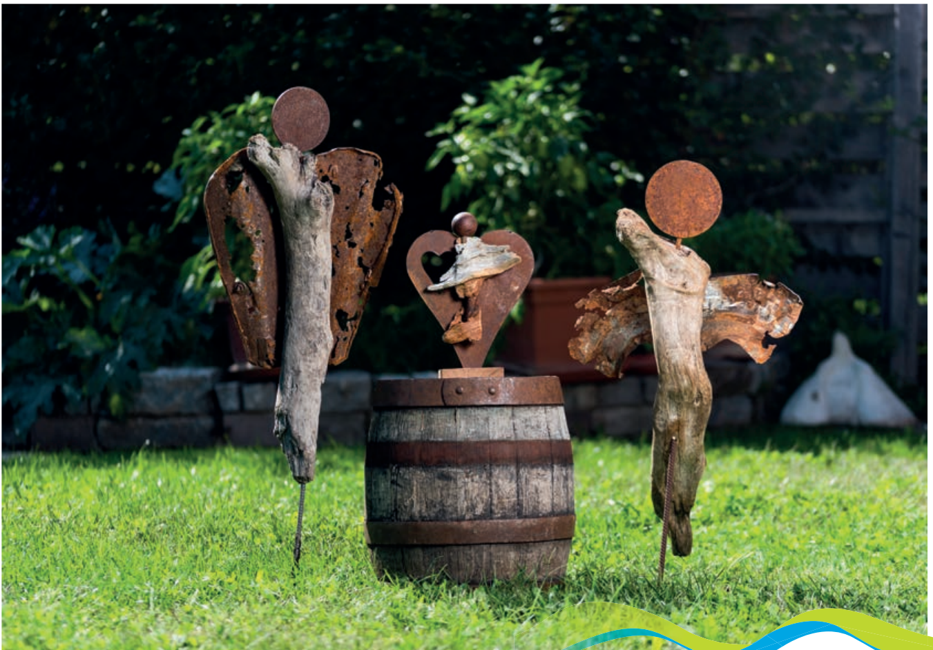
Naturpark Engerl'n

Am Rande von Villach, unter dem Naturpark Dobratsch, liegt mein Haus und meine Werkstatt. Meinen Garten verwende ich als Galerie für meine Produkte, die dort bewundert werden können. Aus den verschiedenen Hölzern, die ich im Naturpark Dobratsch finde, fertige ich individuelle Engerl'n in verschiedenen Größen. Kein Engel gleicht dem anderen, da ich verschiedene Materialien miteinander kombiniere.