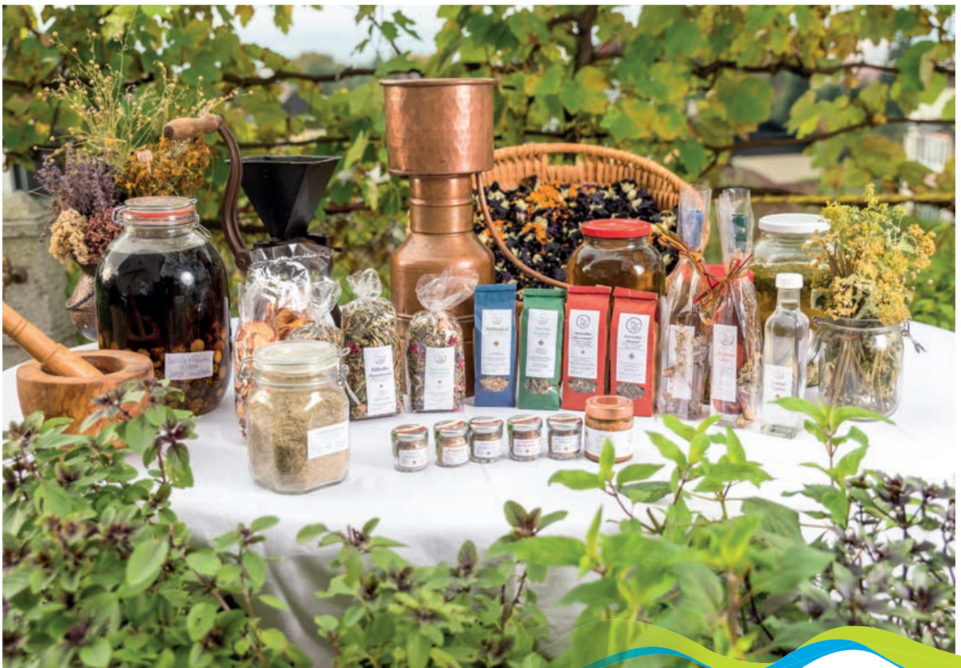
Produktpalette | © Michael Stabentheiner

Die Kräuterspatzecke Nähe Vassacher See hat keine eigenen Öffnungszeiten, denn sofern das Wetter passt, bin ich im Naturpark unterwegs, pflücke Kräuter, grabe Wurzeln oder ernte Rinden und Harze. Meine Produkte sind allesamt aus Wildsammlungen hergestellt und von daher gibt es nicht immer alles und zu jeder Zeit – dafür ist die Qualität einzigartig.