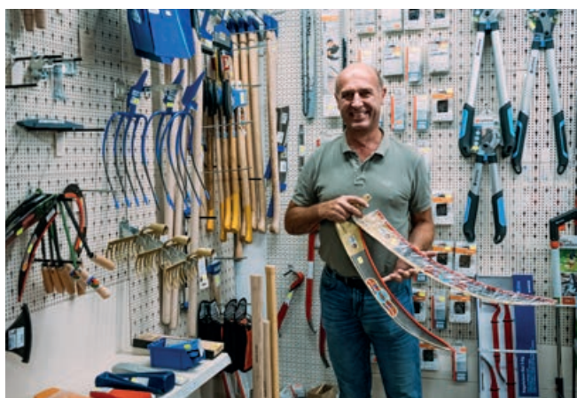
Handwerkszeug und Baustoffe