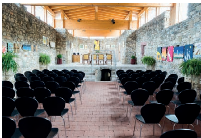
Veranstaltungssaal in der Klosterruine