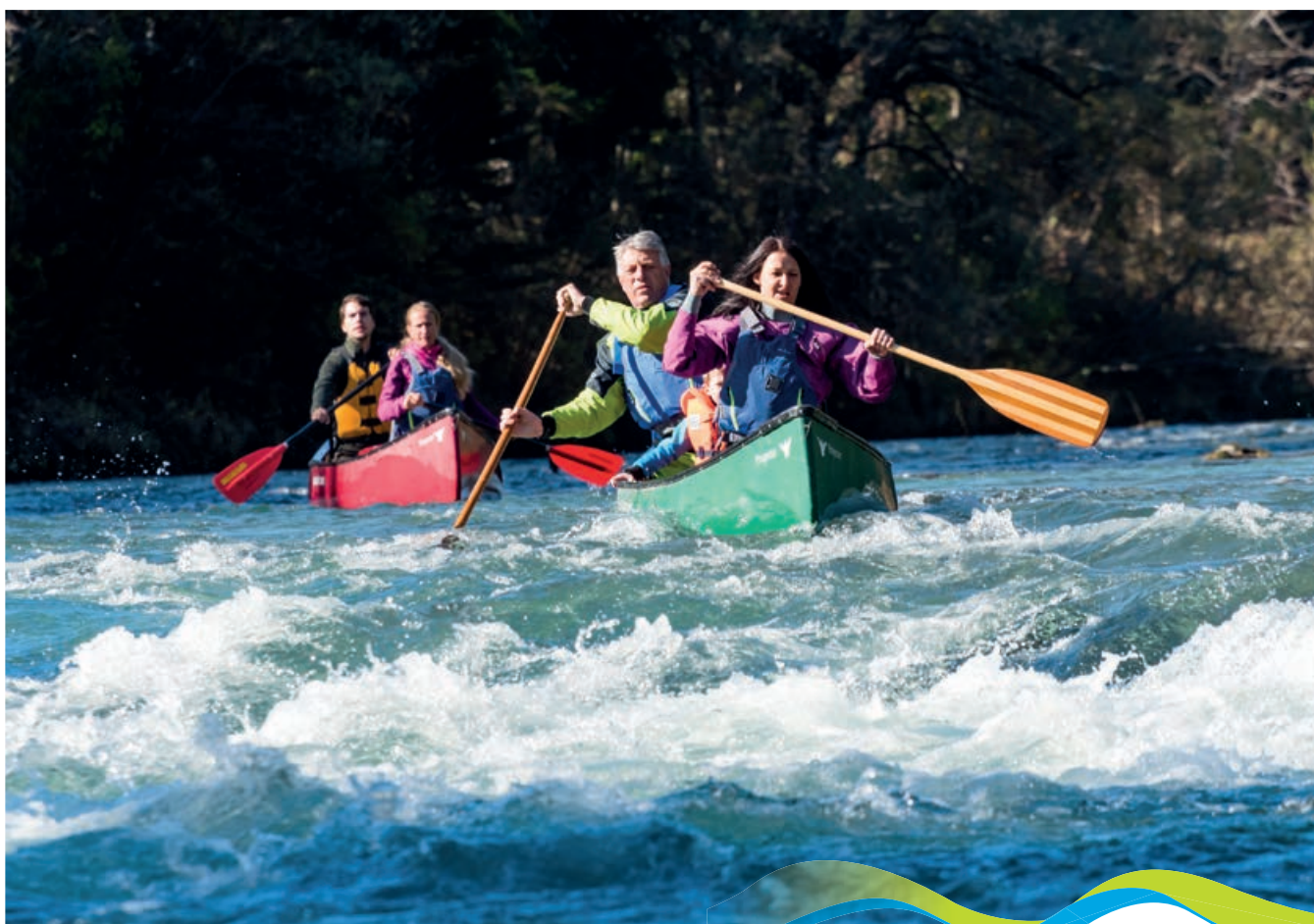
Unterwegs auf der Gail

Seit 2004 in der Naturparkgemeinde Nötsch wohnend, führen wir Kanutouren im Naturpark Dobratsch durch, die uns von der Badebucht Nötsch bis zur Almwirtschaft in der Schütt führen. Schon viel länger sind wir im Kajak-, Canadier- und Raftingsport beheimatet, den wir auch in anderen Regionen anbieten.