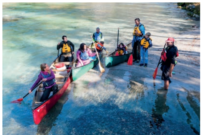
Einschulung der Gruppe