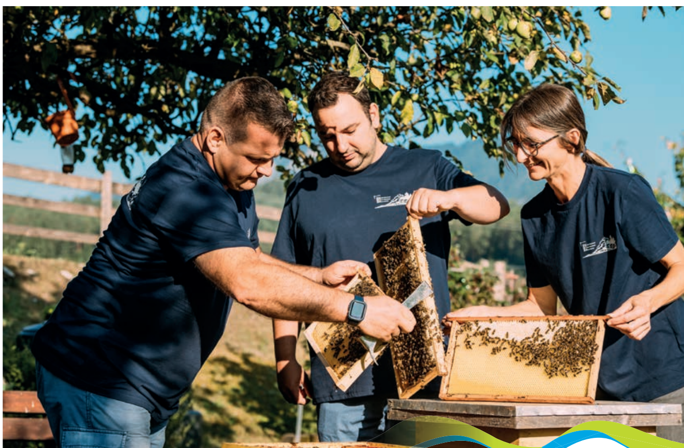
Team MOM | © Sam Strauss

Mitten im Naturpark Dobratsch, in Heiligengeist, liegt unsere Imkerei auf einer Seehöhe von ca. 1000 Metern Seehöhe. Hier kann man nicht nur unseren weit über die Naturparkgrenzen hinaus bekannten Honig verkosten, sondern ihn natürlich auch kaufen. Wenn man noch genug Zeit mitbringt, steht – nach Anmeldung versteht sich – auch einem Rundgang durch unsere Bienenvölker nichts im Weg.