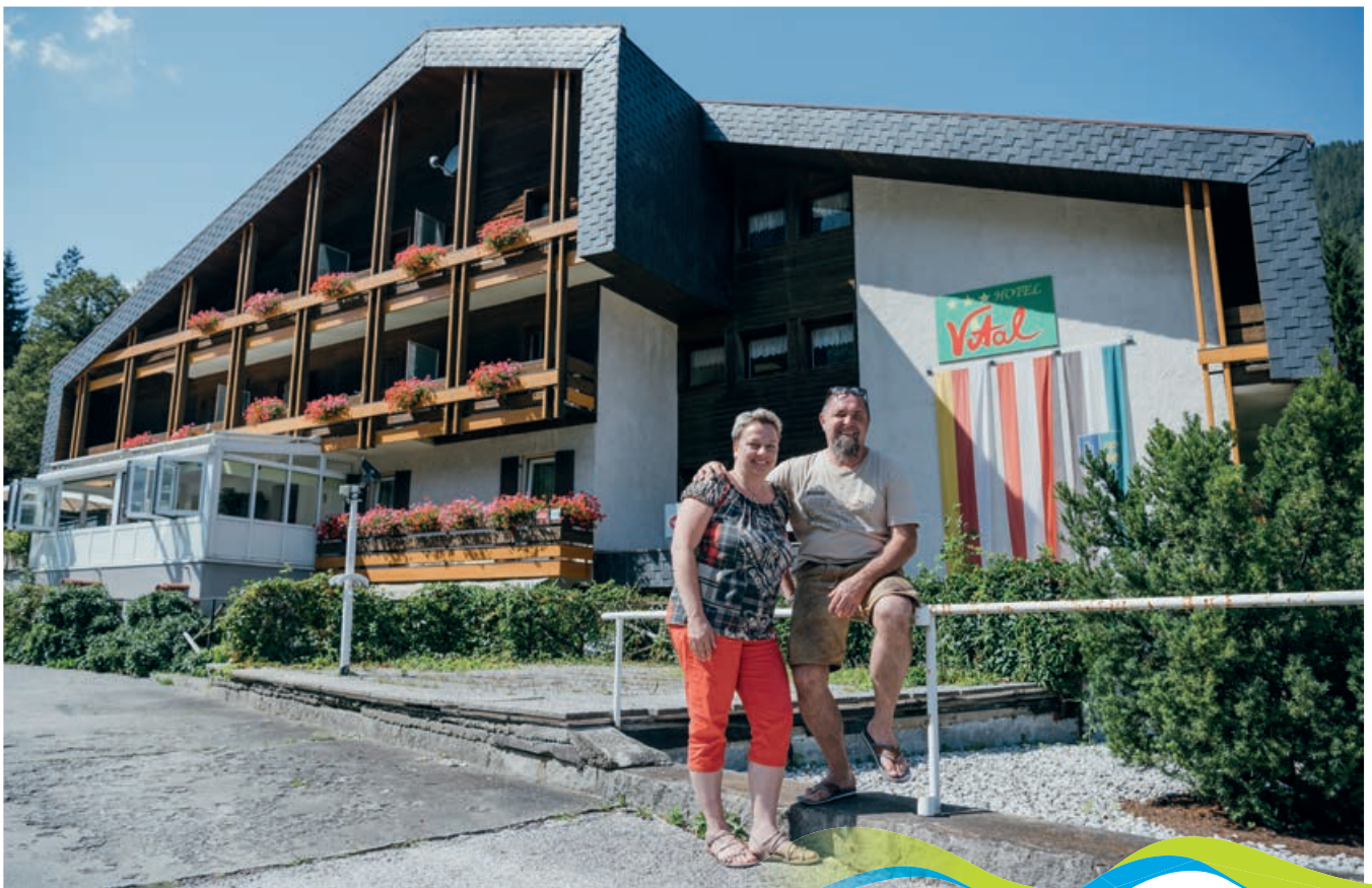
Hotel Vital