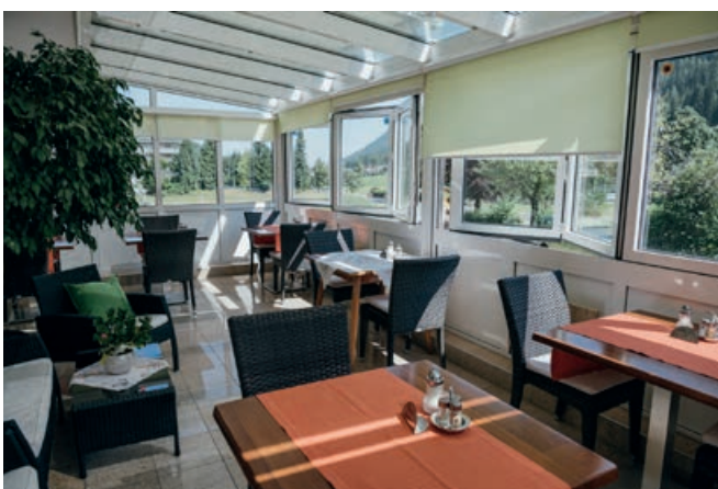
Hotel Vital

Wir bieten Übernachtung mit Genuss-Halbpension, Grillabende auch für Nicht-Hotel-Gäste, die passende Location für Ihre Feierlichkeiten (Geburtstag, Taufe, etc.) sowie Catering innerhalb des Gemeindegebietes.