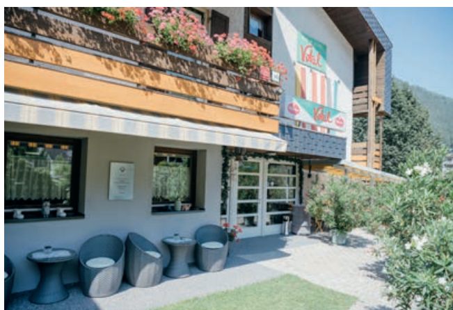
Hotel Vital