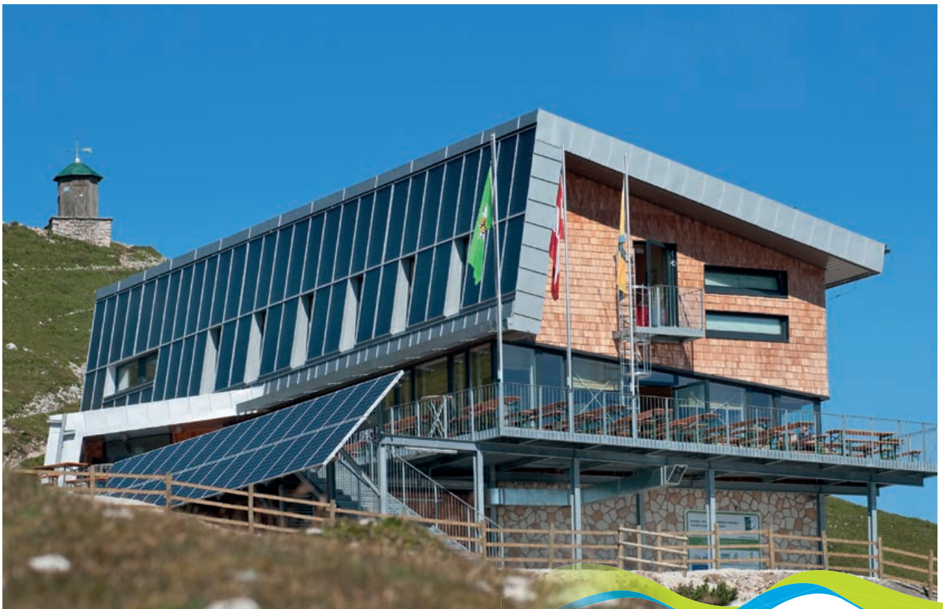
Dobratsch Gipfelhaus

Das erstmals bereits 1810 erbaute Schutzhaus ist im Besitz der Sektion Villach des Österreichischen Alpenvereins. Das in 2143 m Seehöhe gelegene Haus ist nahezu während des gesamten Jahres geöffnet. Lediglich im Frühjahr ist aufgrund der Schneelage (Verwehungen in den Nordkurven am Zehner- und Zwölfernock) eine Versorgung durch die Hüttenpächter unmöglich und das Gipfelhaus daher kurzzeitig geschlossen.