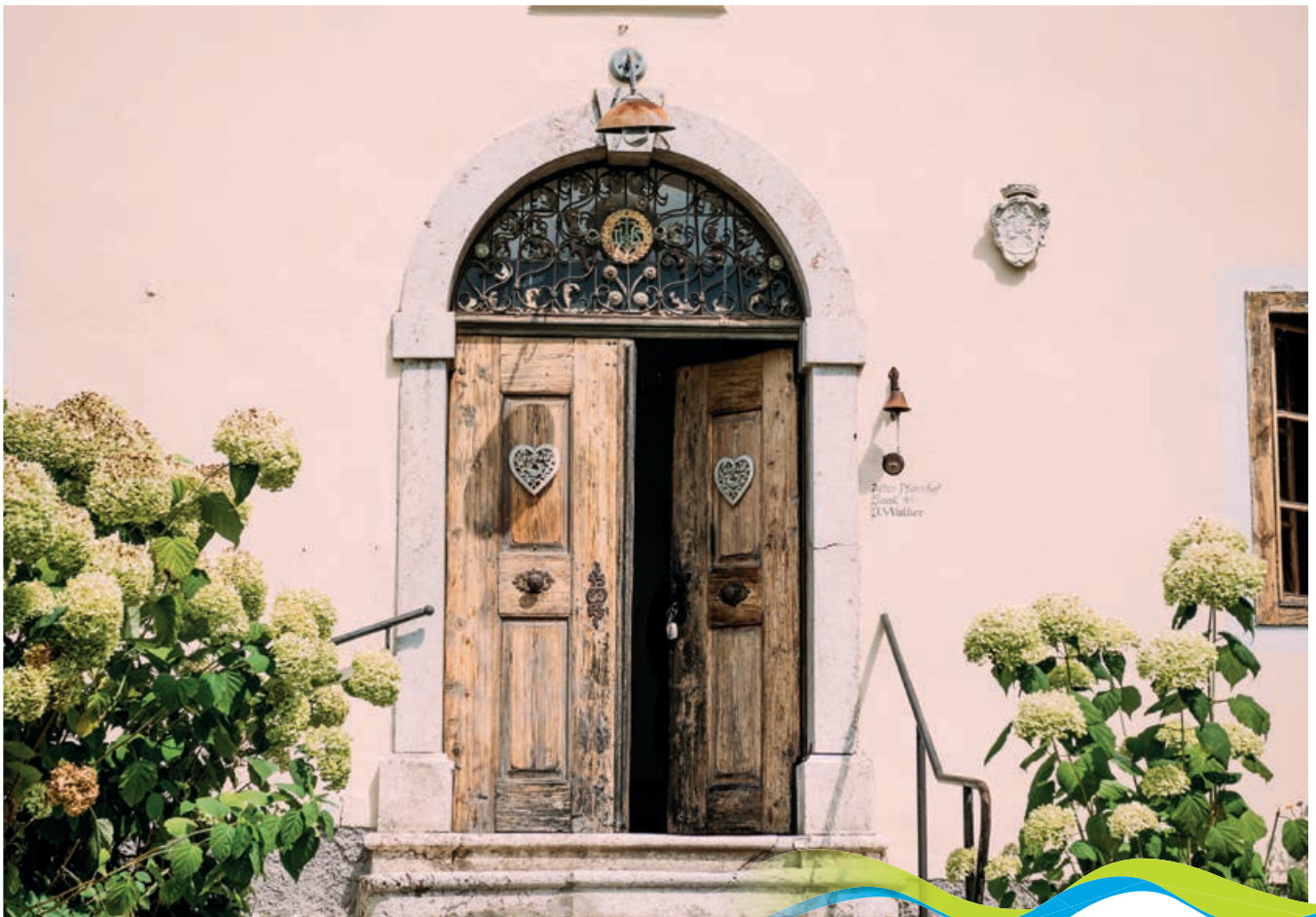
Galerie Walker

Nur wenige Gehminuten vom Museum des Nötscher Kreises entfernt und unmittelbar neben der Pfarrkirche Saak mit beeindruckenden Fresken des Malers Anton Kolig aus dem Jahr 1927, liegt der Alte Pfarrhof. Seit 2012 ist dieses spätbarocke Haus in unserem Besitz, wurde über viele Jahre liebevoll restauriert. Für kulturinteressierte Besucher ist der Alte Pfarrhof vorwiegend nach Terminvereinbarung geöffnet.