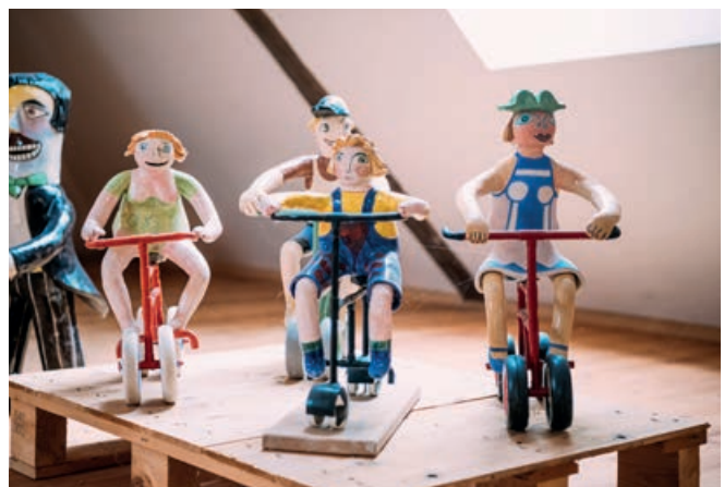
Kunstobjekte | © Sam Strauss