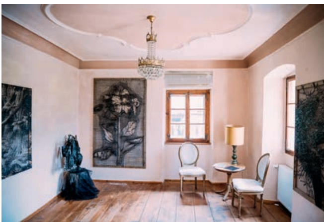
Galerie | © Sam Strauss

Unser Schwerpunkt liegt auf zeitgenössischer nationaler und internationaler Kunst. Die leuchtenden, dynamischen Malereien der Künstlerin Helga Druml und des Künstlers Alex Amann, die in Nötsch leben und arbeiten, sind eben- so zu entdecken wie die Skulpturen des aus Villach stam- menden Biennale-Künstlers Bruno Gironcoli. Darüber hi- naus präsentieren wir Werke von Valentin Oman, Meina Schellander, Reimo Wukounig, Herbert Unterberger, Peter Krawagna, Gudrun Kampl, Arno Popotnig und vielen an- deren.