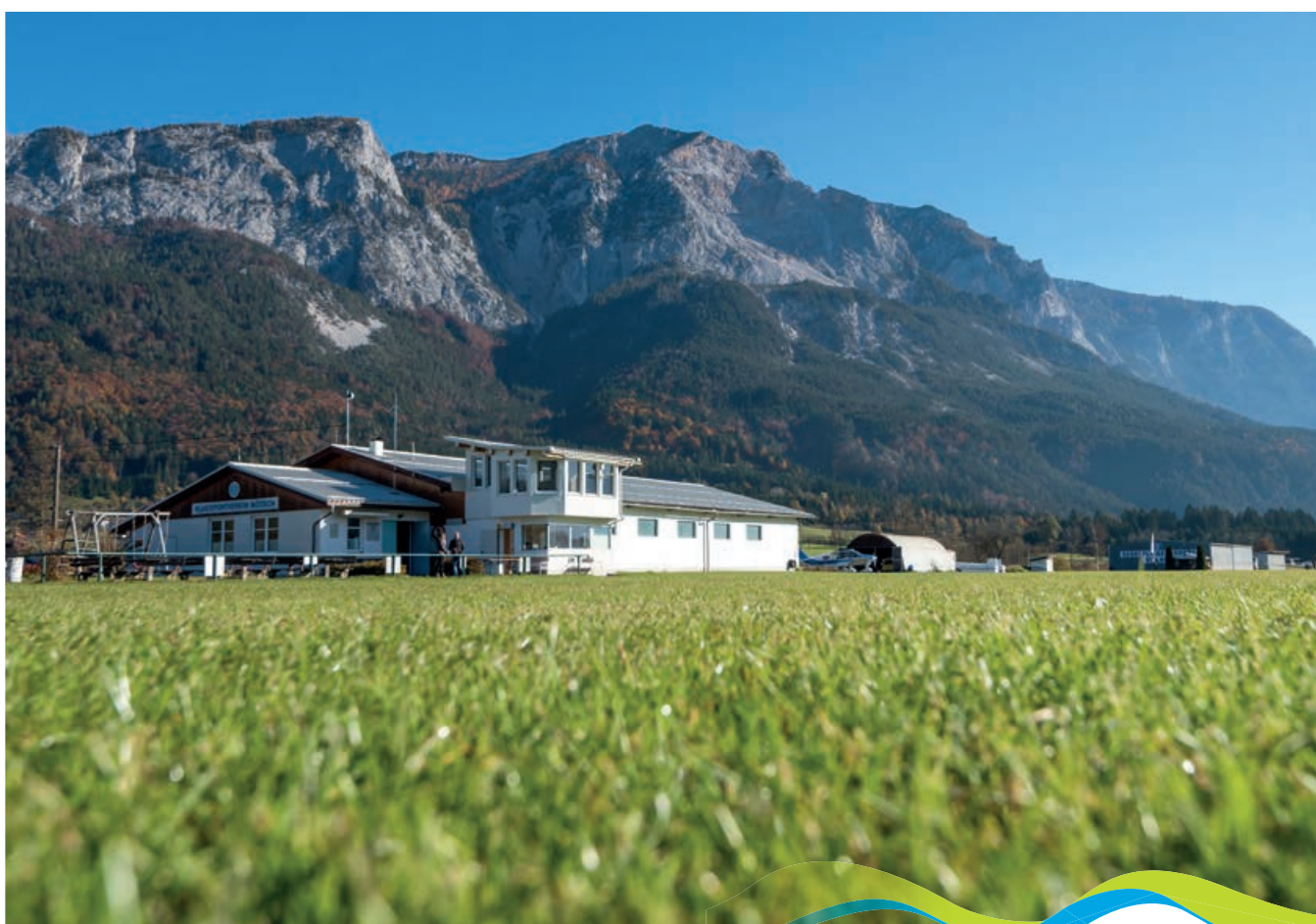
Flugsportverein Nötsch

Unser Flugplatz liegt am Fuße des Dobratsch in Nötsch. Von dort aus starten wir mit unseren Segelflugzeugen und nutzen die Aufwinde der Südwand des Dobratsch, um Strecken bis über 1.200 km ohne Motor zu fliegen.