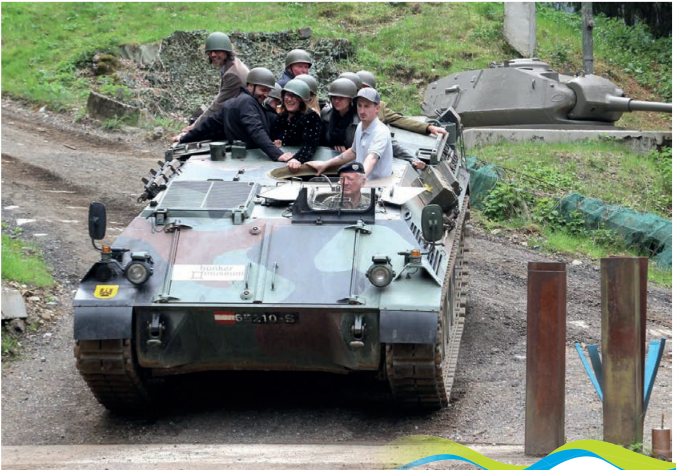
Panzerfahrt durch das Bunkergelände

Im „Kalten Krieg“ jahrzehntelang geheim – seit 2005 öffentlich zugänglich: Österreichs größtes Verteidigungssystem (1963-2002) am Wurzenpass/Dreiländereck. Mit originalen Bunkern, Verbindungsgräben und Kampfstellungen – ergänzt mit Sperren sowie einer kompletten Ausstellung aller verbunkerten und mobilen Waffensysteme der Sperrtruppe. Wir bieten ein einzigartiges Besucherlebnis für die ganze Familie.