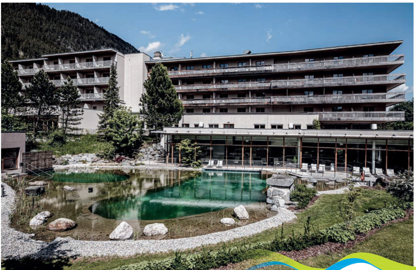
BLEIB BERG F.X. Mayr Retreat