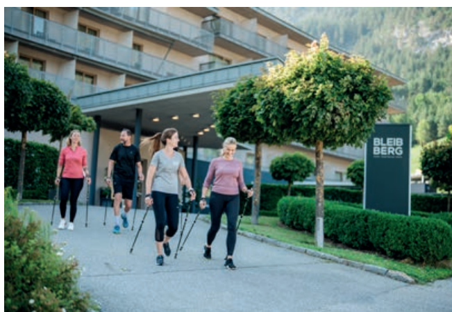
Gesunde Bewegung