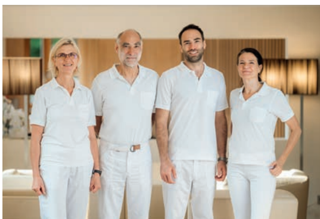
Team BLEIB BERG

Neben den klassischen Programmen bietet das BLEIB BERG eine Vielzahl an wohltuenden Behandlungen und Aktivitäten. Von geführten Wanderungen in der malethischen Bergwelt über Yoga und Meditation bis hin zu Spa-Behandlungen – alles ist darauf ausgerichtet, die Energiereserven aufzutanken. Ein wahres Highlight ist der Heilklimastollen „Friedrich“. Der Stollen hat eine konstante Temperatur von 8°C und eine Luftfeuchtigkeit von 99%, dieses offiziell anerkannte Heilklima ist unter anderem sehr wohltuend für Allergiker:innen oder Asthmatiker:innen. Moderne diagnostische Methoden ergänzen das ganzheitliche Konzept und sorgen dafür, dass individuelle Gesundheitsbedürfnisse präzise berücksichtigt werden.