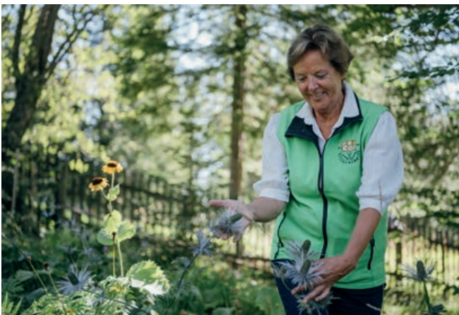
Blumen- und Kräuterpflege

Der Alpengarten Villacher Alpe ist ein Naturgarten. Auf einer Fläche von etwa 10.000 Quadratmetern zeigen wir mehr als 700 Pflanzenarten, überwiegend Vertreter der montanen und alpinen Kalkflora der Südalpen. Sie wurden entsprechend ihrer ökologischen Zugehörigkeit in 26 Pflanzenquartieren angepflanzt und werden laufend aus eigener Anzucht ergänzt. Zum Erkennen der Pflanzen sind im Garten 1200 Schilder aufgestellt, und Infotafeln ergänzen das Angebot. Bei rechtzeitiger Voranmeldung können für Gruppen Führungen organisiert werden. Auch über Schülergruppen freuen wir uns. Gegen eine kleine Spende geben wir überzählige Pflanzen und Saatgut an unsere Besucher ab.