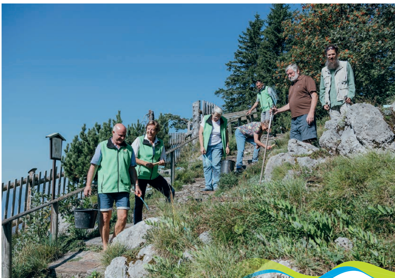
Alpengarten Villacher Alpe

Auf der Villacher Alpe (Dobratsch, 2166 Meter), befindet sich in einer Seehöhe von 1500 Meter – mitten im Naturpark – der Alpengarten Villacher Alpe. Auf gepflegten Wegen können unsere Gäste hunderte verschiedene Bergblumen bewundern, darunter Besonderheiten wie Frauenschuh, Krainer Lilie oder Alpenmannstreu, viele Heilpflanzen und natürlich Petergamm, Enzian und Edelweiss.