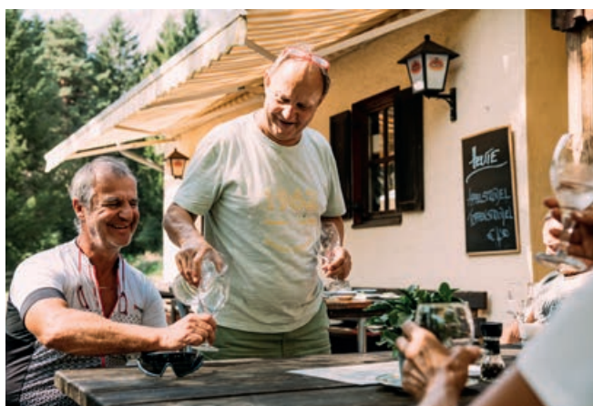
Almwirtschaft Schütt