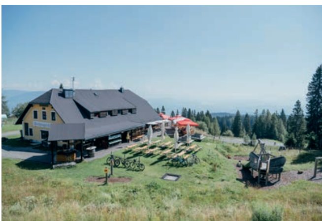
Aichinger Hütte

Bei der Verköstigung der Besucher und dem gesamten Betrieb der Almhütte hilft die ganze Familie mit. Dies schlägt sich auch im Angebot in der Speisekarte, die viele Speisen traditioneller Hausmannskost enthält, nieder. Darunter lässt sich das legendäre Backhendl finden und es gibt sogar Produkte aus der eigenen Landwirtschaft, wie Speck und Würsteln. Saisonal werden Köstlichkeiten vom Wild aufgetischt, das ebenso aus dem Naturpark Dobratsch stammt. Wer es süßer möchte, kann beim Kaiserschmarrn zugreifen oder von den täglich frisch gebackenen Kuchen probieren. Zur Nachspeise kann die junge Wirtin aber auch einen eigens mit Kräutern vom Dobratsch angesetzten Schnaps servieren.