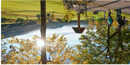
TOP Dobratsch Rundwanderweg Naturerlebnisweg